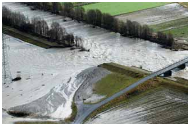
«Der Damm ist gebrochen!»

Wann kehren wir zu einer qualifizierten Einwanderung zurück, welche sich den Bedürfnissen des Landes anpasst? EU-Länder wie etwa Spanien bewegen Gast-Arbeitslose zur Rückkehr. Dieser Weg wird auch der Schweiz, wo die Sozialleistungen deutlich höher sind, nicht erspart bleiben. Die Schweiz steuert auf ein grosses Debakel zu, und der Bundesrat sieht tatenlos zu.