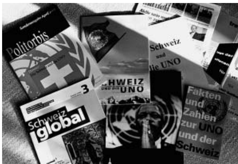
Mit zahlreichen Hochglanz-Broschüren und teurem PR-Material macht der Bundesrat mit Steuergeldern einseitige Staatspropaganda für einen UNO-Beitritt.

Solche demokratiefeindlichen Machenschaften zulasten der Steuerzahler sind ein Skandal!