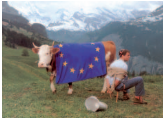
Ein EU-Beitritt legt das Schweizer Volk in Fesseln!