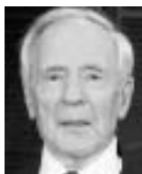
Dr. Klaus von Dohnanyi Ehemaliger Bundesminister, Mitglied der SPD