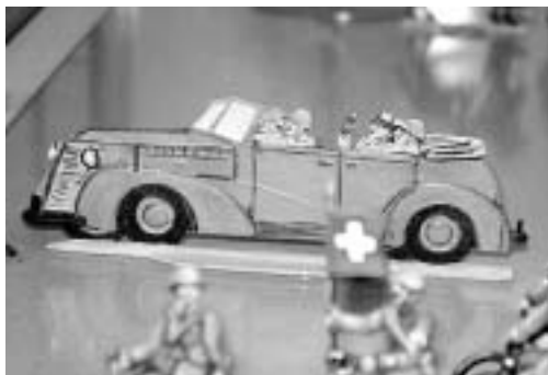
Für Bergier-Ideologen nur ein Mythos: General Guisan, Schweizer Armee, Leistung der Aktivdienstgeneration

Der Bergier-Bericht will die Geschichte umschreiben, um die Gegenwart politisch zu manipulieren. Der Chef-Ideologe der Bergier-Kommission, Georg Kreis, hat dies in erstaunlicher Offenheit zugegeben. Ziel sei, der Schweiz endlich eine «vorwärts gerichtete Aussenpolitik» (er meint damit den EU-Beitritt) zu verpassen: «Mit einem rückwärts gewandten, beschönigenden und unvollständigen Geschichtsbild kann keine vorwärts gerichtete Aussenpolitik gemacht werden.» Ein entlarvender Satz, der die wahre Absicht zeigt: Die damalige gewaltige Leistung der Schweiz, trotz jahrelanger Umzingelung und Bedrohung standhaft zu bleiben und unsere Demokratie nicht dem totalitären Europa der Nazis zu opfern, wird als «Mythos» (Ausdruck der Bergier-Leute) bezeichnet. Gezielt wird – auch im erwähnten Schulbuch – der Eindruck erweckt, wir hätten mit Nazi-Deutschland kooperiert.