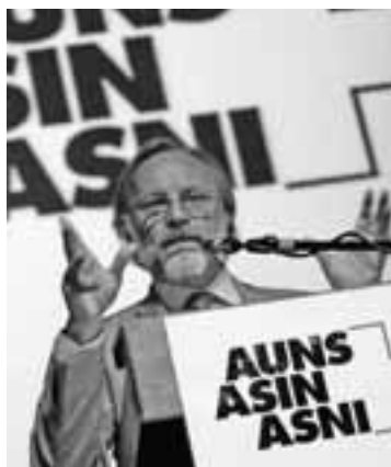
Dr. Michael Reiterer, Botschafter der EU in der Schweiz (keystone)

Aus Schweizer Sicht fallen laut Köppel die schweren Demokratiedefizite der EU besonders ins Gewicht. Die Schweiz tue deshalb gut daran, sich auf dem bilateralen Weg auf Distanz zu halten. Wenn der EU-Botschafter den Eidgenossen vorhalte, man könne nicht immer «abseits stehen», dann verkenne er die rechtsstaatliche Sensibilität der Schweizer gründlich. Der Erfolg der Schweiz gründe auf ihrer Unabhängigkeit, der direkten Demokratie, der Volkssouveränität, der Neutralität und der Selbstverantwortung, der Leistungsbereitschaft und dem Wettbewerb. «Der Steuerwettbewerb ist eine Voraussetzung politischer Freiheit. Er macht Druck auf die Politik, er schafft Vielfalt und Auswahl. Und wer sich billiger und besser organisiert, zieht Erfolgreiche und Talente an.»