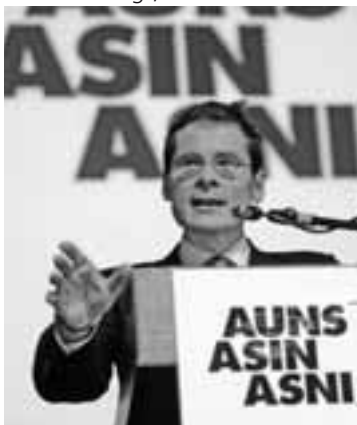
Roger Köppel, Chefredaktor der Weltwoche