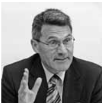
Nationalrat Dr. Pirmin Schwander, Präsident der AUNS

Unter dem Titel «Wahrung der Volksrechte statt aussenpolitisches Geschwätz» verurteilte Pirmin Schwander die Aussenpolitik von Bundesrat und Parlament, welche die schweizerische Souveränität und Neutralität zunehmend preisgäben, den Interessen unseres Landes schaden und den Volkswillen missachteten. An die Adresse Brüssels gerichtet, forderte Schwander Respekt vor der schweizerischen Demokratie, vor unserer staatlichen Eigenständigkeit und der Steuerhoheit. «Wir akzeptieren keinerlei Einmischung in innere Angelegenheiten.» Wer an staatlichen Grenzen Staus produziere, wer in die Steuerhoheit anderer Staaten eingreifen wolle und demokratisch zustande gekommene Regierungskoalitionen in Frage stelle, habe die europäische Idee längst verraten. Die europäische Idee brauche kein gigantisches Regelwerk zur Gleichmacherei sondern unterschiedliche Kulturen und Systeme im Sinne der Schweiz.