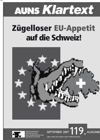
«AUNS Klartext» – das neue Bulletin der AUNS

Im Berichtsjahr erschienen insgesamt sechs Ausgaben des Grauen Briefes bzw. des neu konzipierten «AUNS Klartextes», nämlich die Nummern 115–120. Im Zuge des erneuerten AUNS-Konzeptes (mehr Eigenständigkeit, mehr Konzentration auf den Kernbereich, Auftritt leserfreundlicher/attraktiver) wurde unsere Informationsbroschüre «Grauer Brief» zum erwähnten »AUNS Klartext« modifiziert. Thematisch im Zentrum standen der EU-(Nicht-) Beitritt, die EU-Steuervögte, Schengen, die Neutralität (Schwarzbuch), die Milizarmee, die Volksrechte. In der Regel umfasst ein «AUNS Klartext», der auch als «Bulletin d'information» französisch und als «Bolletino d'informazione» italienisch erscheint, vier bis acht Seiten. Das AUNS-Bulletin erfüllt die Aufgabe, mit klaren Botschaften, Kurzinformationen, Zahlen und Fakten die AUNS-Mitglieder und weitere Interessierte über die Entwicklung in der schweizerischen Aussenpolitik zu informieren.