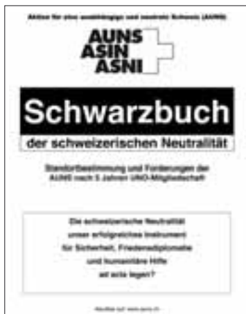
Titelseite des AUNS-Schwarzbuches zur Neutralität (abrufbar auf www.auns.ch )

Die Nationalräte Hans Fehr und Ivan Perrin nannten aus der Fülle von schwerwiegenden Neutralitätsverstössen durch die Bundesräte Calmy-Rey und Schmid insbesondere die Forderung «der Schweiz» nach einem unabhängigen Kosovo, die Einmischung in die hochbrisante Frage des iranischen Atomprogramms, den Drang der Aussenministerin nach einem Schweizer Sitz im UNO-Sicherheitsrat sowie den geradezu pathologischen Drang im VBS zur NATO-Anpassung und zu militärischen Auslandseinsätzen.