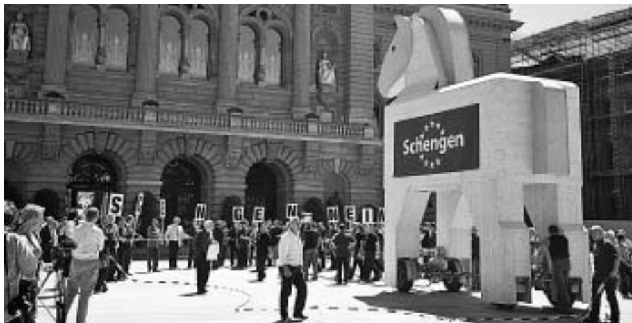
Eindrückliche Manifestation gegen Schengen auf dem Bundesplatz, vom Staatsfernsehen totgeschwiegen.

Abstimmungskampf geführt. Mit einer Vielzahl von Stand- und Strassenaktionen, mit Leserbriefen, Zeitungsartikeln, Plakaten, Flugblättern, Veranstaltungen und Inserataktionen haben wir unsere Kampagne gegen die Koalition der Befürworter geführt.